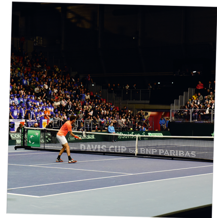
Davis Cup 2018 Frankreich vs Niederlande