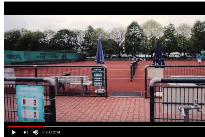
TC Eichenau Image Film

- 9 Freiplätze - 492 Mitglieder (Jugend: 186)